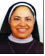
സി. മേമ്പിൾ സി.എം.സി.